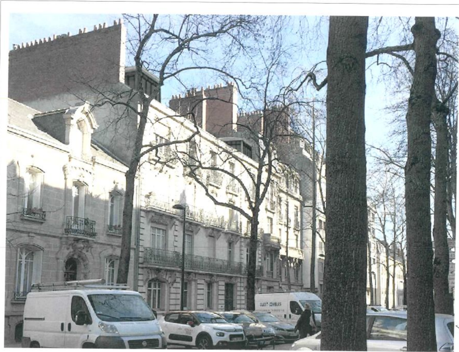
VUE DEPUIS LA MODIFICATION DE FACADE BOULEVARD GUISTHAU