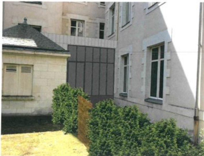
VUE DEPUIS LE HALL D'ENTREE VITREE