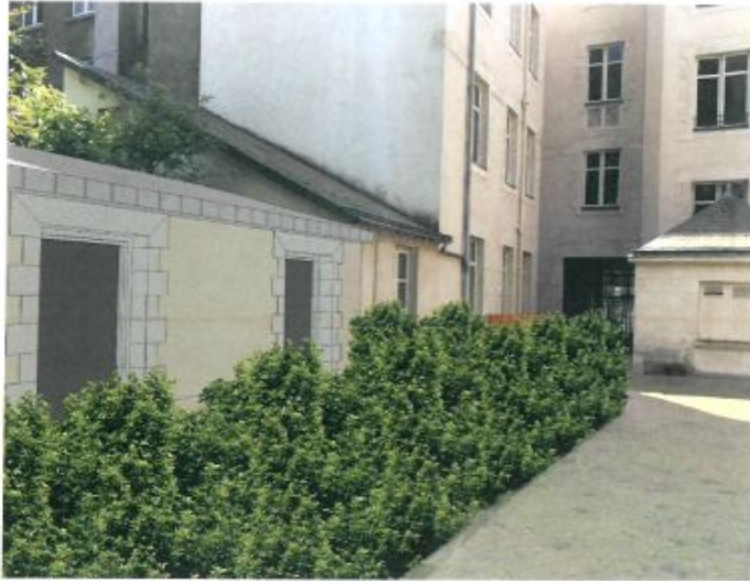
EXTENSION DU LOCAL ACTIVITE