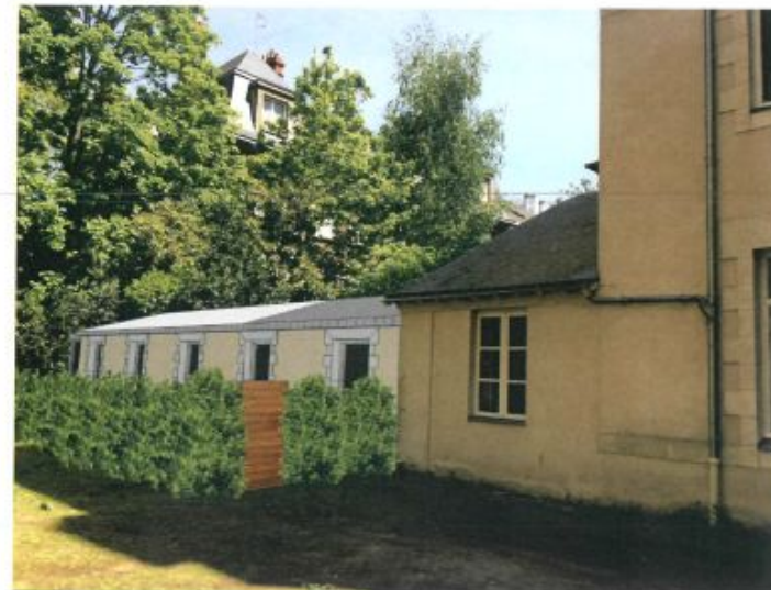
VUE DEPUIS L'EXTENSION DU LOCAL ACTIVITE ET LOCAL VELO