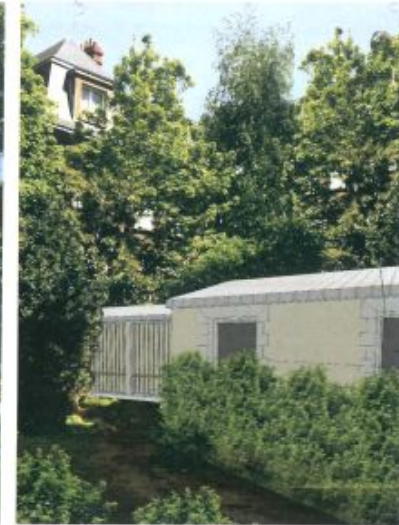
VUE DEPUIS L'EXTENSION DU LOCAL ACTIVITE ET LOCAL VELO