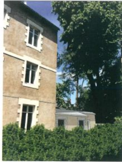
RENOVATION ET EXTENSION DE FACADE NORD EST